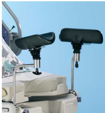
Par de perneras (sistema rótula) 100033957