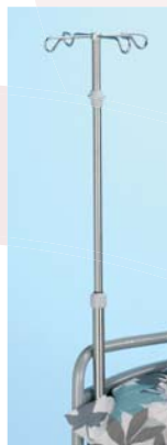
Barra de infusión 2 ganchos 100005780 4 ganchos 100000499