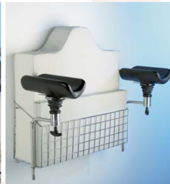
Cestillo para el juego de colchones 100033974 Juego de colchones A42195800