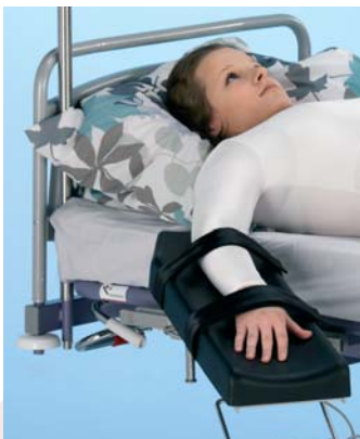
Soporte de brazo 100000127

Colores opcionales para las barandillas y hastiales de la cama: Morado (RAL 4012) amarillo (RAL 1003) verde claro (RAL 6021), rojo (RAL 3020), azul (RAL 5023), blanco (RAL 9002), azul claro (RAL 5024), beige (RAL 1015)