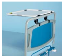
Bandeja para el monitor 128009768