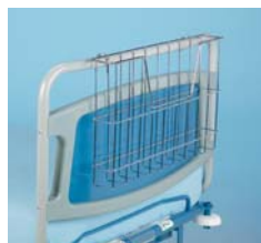
Cestillo para las revistas 128009784