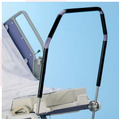
Barra laboral (SQUAT) A42151700