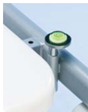
Nivel de burbuja A42068000