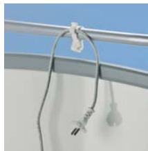
Gancho para cable eléctrico A41987307