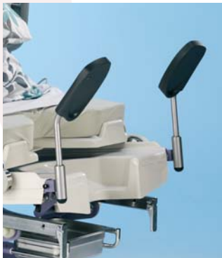
Soportes para los pies (incluidos)