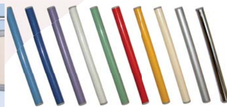
Colores opcionales para el base de colchón Morado (RAL 4012) amarilla (RAL 1003) verde claro (RAL 6021), rojo (RAL 3020), azul (RAL 5023), blanco (RAL 9002), azul claro (RAL 5024), beige (RAL 1015), plata (RAL 9006)

Colores opcionales para las barandillas y hastiales de la cama: Morado (RAL 4012) amarillo (RAL 1003) verde claro (RAL 6021), rojo (RAL 3020), azul (RAL 5023), blanco (RAL 9002), azul claro (RAL 5024), beige (RAL 1015)