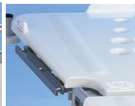
Raíl para los accesorios 100000701 (requiere: puntos de fijación de accesorios en la sección respaldo A41980200)