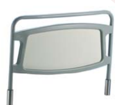
Hastial de cama plegable A41935200