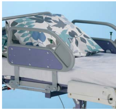
Barandillas (en 2 secciones) A42200100 (requiere: puntos de fijación de accesorios en la sección respaldo A41980200)